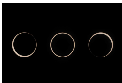
< 金環日食 >